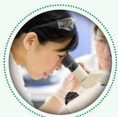
Zéro déchet de production