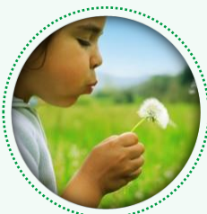
Utilisation efficace des ressources