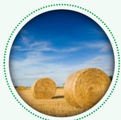
Matières premières à faible teneur en carbone