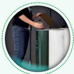
Réduction des déchets après utilisation