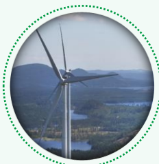
Production sans combustibles fossiles